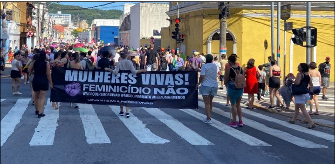
Manifestação em Florianópolis pelo fim dos feminicídios teve caminhada pelas ruas da cidade