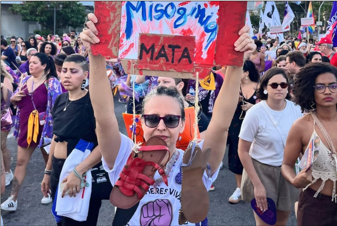
No Recife, mulheres participam de mobilização nacional contra feminicídio