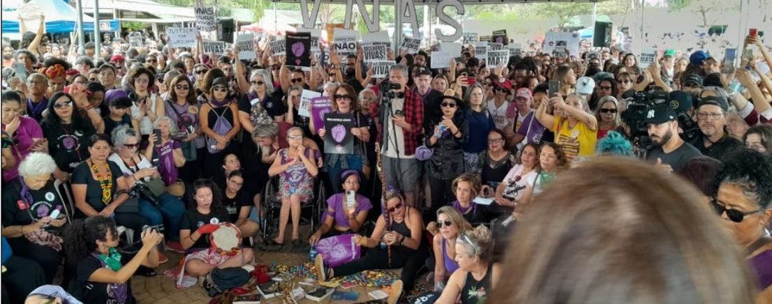
Mulheres protestam contra feminicídios em Brasília