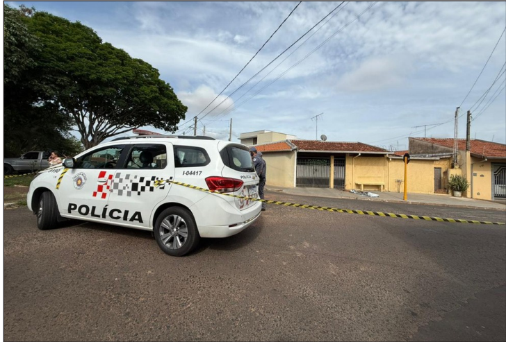
Crime aconteceu quando a vítima chegava para trabalhar em Bauru

Vítima, de 20 anos, foi ferida por golpes de faca dentro de casa, mas conseguiu pedir socorro a um vizinho. Suspeito, de 55 anos, foi encontrado morto após o crime, na manhã de sábado (6).