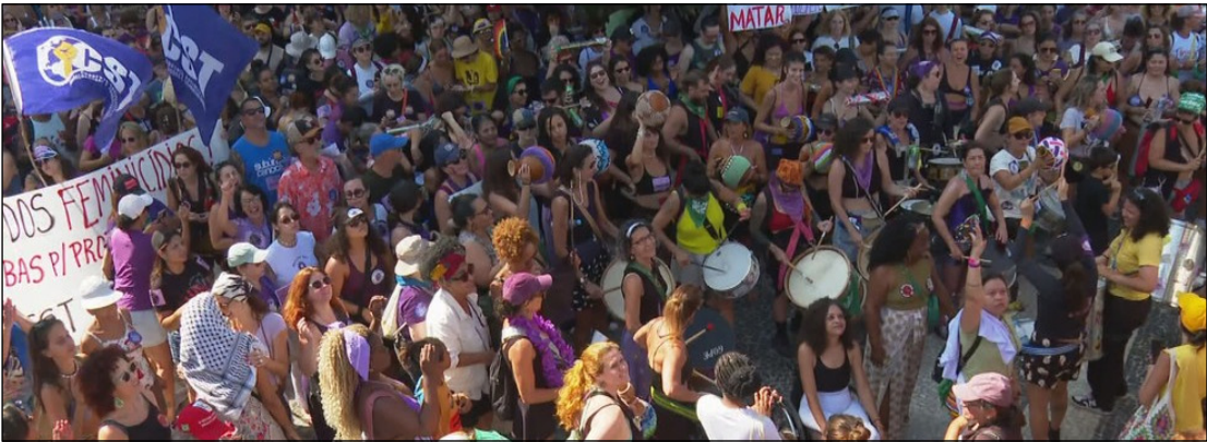
Protesto contra feminicídio reúne manifestantes em Copacabana