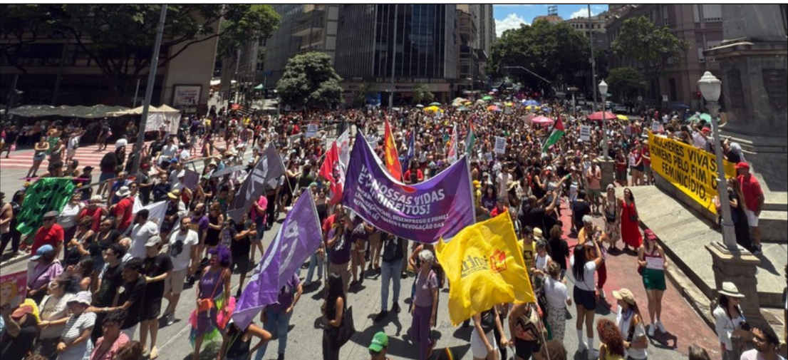
Belo Horizonte teve ato nacional contra o feminicídio neste domingo