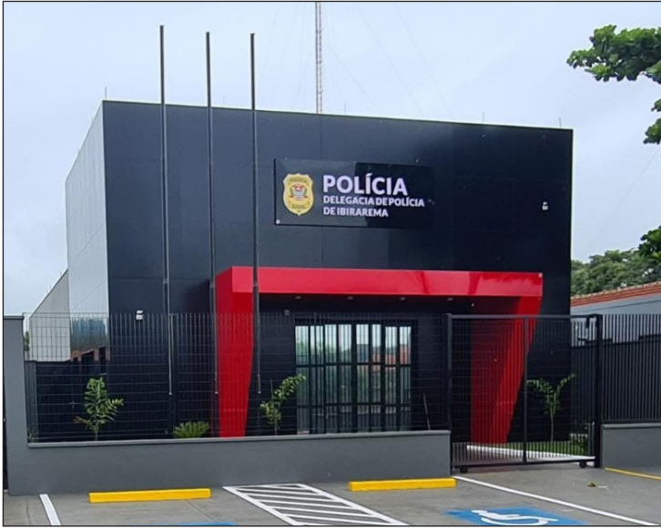
Caso foi registrado na Polícia Civil de Ibirarema (SP)

Segundo a Polícia Militar, que foi acionada para atender a ocorrência, a jovem, mesmo ferida, conseguiu fugir da residência e pedir socorro a um vizinho, que a levou até um hos-