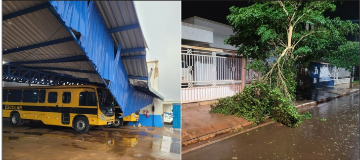
Imóveis foram atingidos por chuva forte em Taquarituba (SP), segundo a Defesa Civil

morreu ao bater na traseira de um caminhão durante a chuva na madrugada deste sábado.