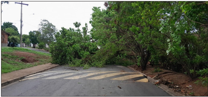
Chuva causa queda de árvores em Catanduva (SP)

A chuva também provocou estragos em outras cidades do interior de São Paulo. Em Capão Bonito (SP), um motociclista