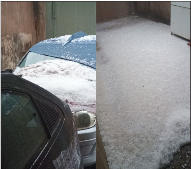
Chuva acompanhada com queda de granizo causou estragos em São Manuel — Foto: Prefeitura de São Manuel/reprodução

A guarda municipal, secretarias e até uma estrutura do estado estão colaborando com a Defesa Civil, que disponibilizou um canal de atendimento para as emergências pelo telefone (14) 99799-5343.