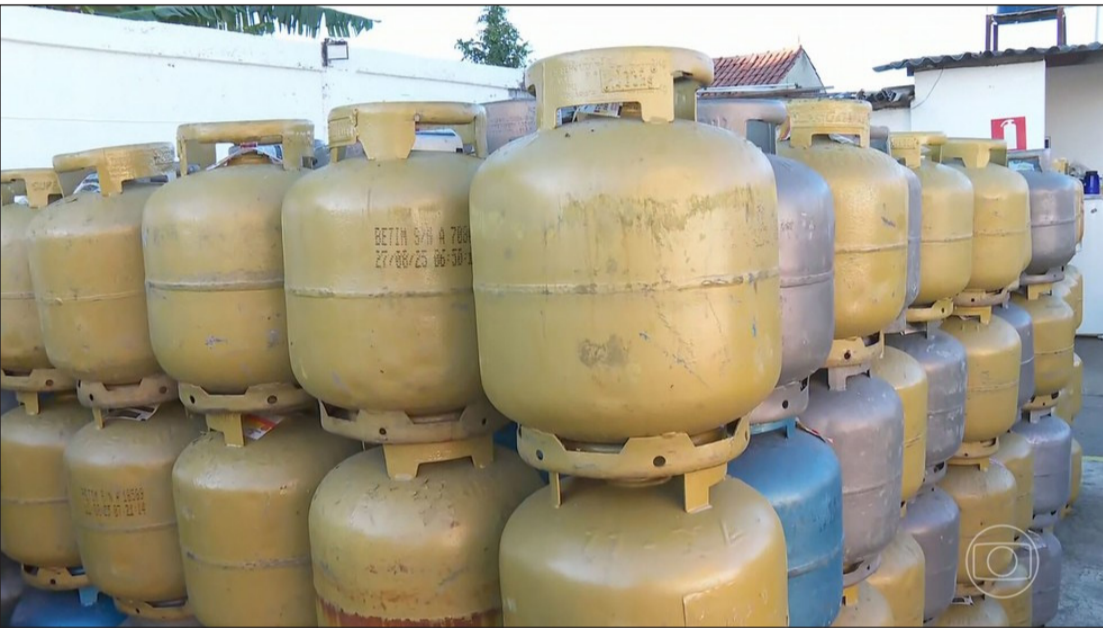
Governo lança programa que amplia acesso ao gás de cozinha

Implementação do auxílio será gradual e, nesta primeira etapa, a previsão é atender 1 milhão de famílias em dez capitais das cinco regiões do Brasil.