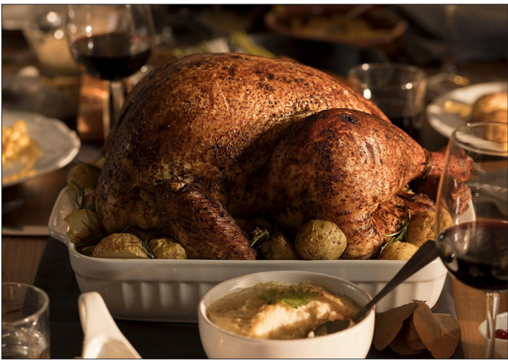
Nestes casos, pela legislação, os produtos têm que ter esta informação em suas embalagens, com destaque, por no mínimo seis meses.

Procon-SP comparou a diferença de preços de produtos tradicionais das ceias natalinas praticados em supermercados de Presidente Prudente, Bauru, São José do Rio Preto e Sorocaba. Segundo o Programa de Proteção e Defesa do Consumidor (Procon), o objetivo da pesquisa é oferecer uma referência ao consumidor através dos preços médios obtidos dentro da amostra pesquisada. Em Presidente Prudente (SP), a pesquisa foi realizada entre 6 e 9 de dezembro, em oito supermercados. Ao todo, 74 produtos foram comparados, entre azeites, bombons, carnes congeladas, conservas, lentilhas secas, farofas prontas, frutas em calda, panetones e chocotones. Entre os panetones e chocotones, a maior diferença constatada foi de 148% no item mini chocotone – 80 g, com média de preço em R$ 8,37, sendo que o valor mais caro cobrado foi de quase R$ 14. Já o produto com maior