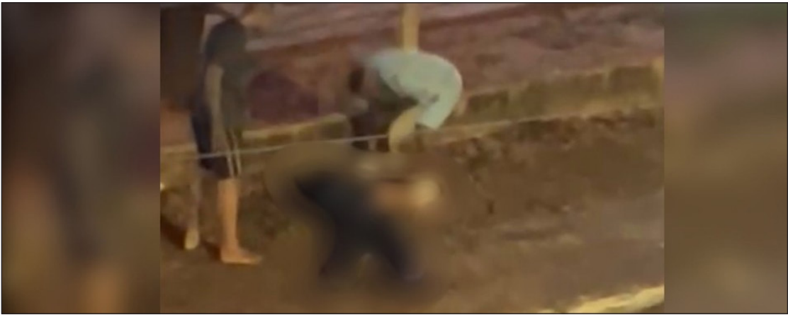
Suspeitos de matar jovem de 19 anos com tiro na cabeça após confusão em festa são presos em Bauru

Crime aconteceu durante evento de pagode no dia 8 de dezembro, na Vila Pacífico. Segundo testemunhas, a confusão começou depois que o primo da vítima, menor de idade, cumprimentou com um beijo uma suposta namorada de um dos suspeitos.