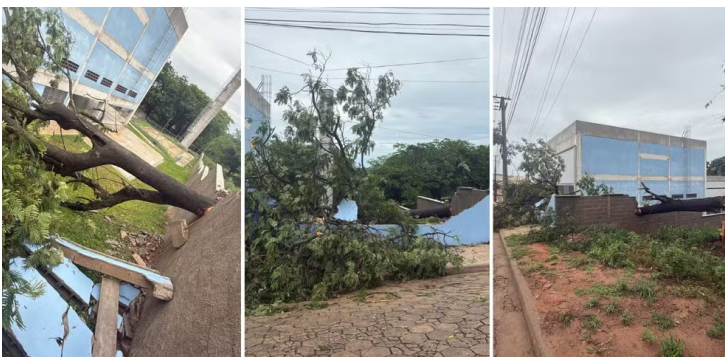
Queda de árvore danificou muro de escola inaugurada há cerca de um mês em Presidente Venceslau

Até a manhã desta terça-feira, três famílias ficaram desalojadas e foram encaminhadas para casas de familiares. Não houve registro de vítimas e equipes da Defesa Civil seguem em campo realizando o levantamento dos danos e prestando auxílio aos moradores afetados.