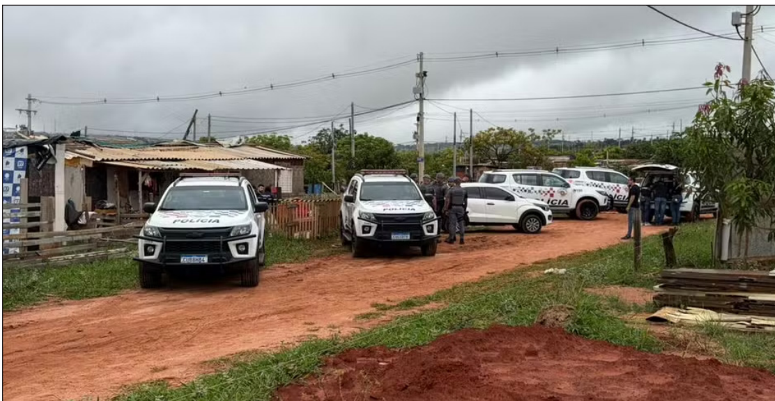
Operação do Gaeco contra PCC e tráfico deixa cinco mortos em confronto com a PM

Com apoio da Polícia Militar, cumprimento de mandados de busca e prisão temporária contra ao menos 25 pessoas suspeitas de integrarem o PCC foi realizado em assentamento. Mortes ocorreram em Bauru, Garça e Tupã (SP).