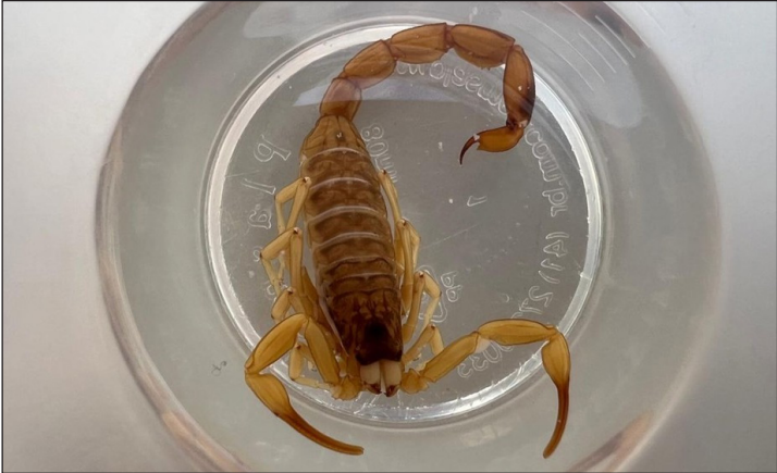
Marília entra em alerta após aumento de quase 50% em acidentes com escorpiões

ticida ou veneno específico para o combate aos escorpiões e o principal método de controle é a prevenção. Orientações da Secretaria de Estado da Saúde de São Paulo •O que é escorpionismo e como ocorre o envenenamento? Escorpionismo é o envenenamento causado pela picada de escorpião.