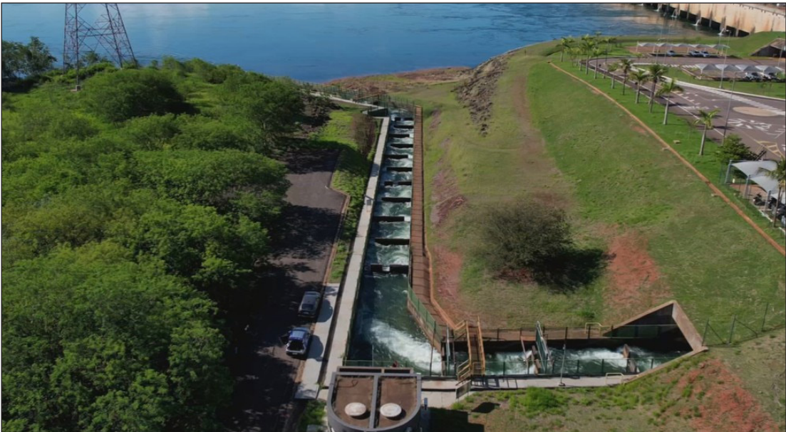
Usina hidrelétrica em Porto Primavera, no Pontal do Paranapanema

tomar ações de conservação com base na ciência e informação. A pesquisa é uma base para que subsidie as ações de conservação que a companhia vai seguir. Essa pesquisa retorna para a sociedade como medidas assertivas voltadas à preservação dos peixes na bacia do Rio Paranapanema”, explica. A microchipagem é realizada por pesquisadores da Companhia Energética de São Paulo (Cesp) e é um dos sete projetos desenvolvidos para a preservação da ictiofauna, a fauna de peixes da região. Para o procedimento, os peixes são capturados por meio de redes, varas e tarafas. Em seguida, recebem um sedativo natural para diminuir a agitação, permitindo que sejam medidos e pesados com segurança. O chip é implantado em um pequeno corte e, na barbatana, vai uma marca externa visível, como uma espécie de “CPF” do peixe. Depois de poucos minutos, eles são